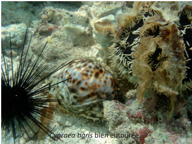
Cypraea tigris bien entourée...