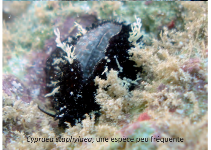
Cypraea staphylaea , une espèce peu fréquente