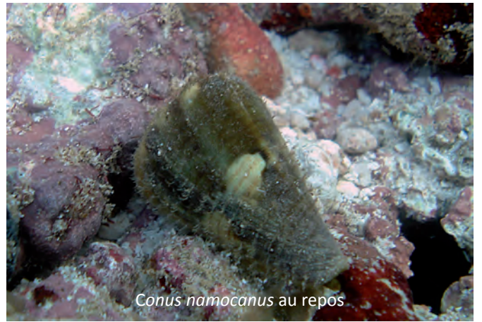
Conus namocanus au repos