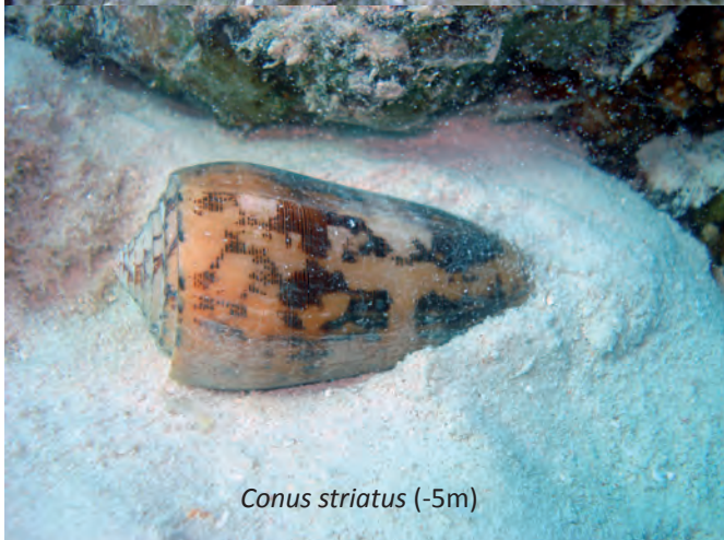
Conus striatus (-5m)