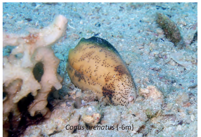
Conus arenatus (-6m)