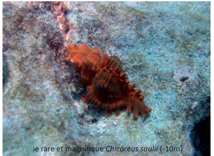
le rare et magnifique Chicoreus saulii (-10m)