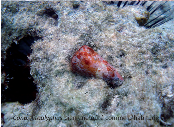
Conus litoglyphus bien encroûté comme d'habitude