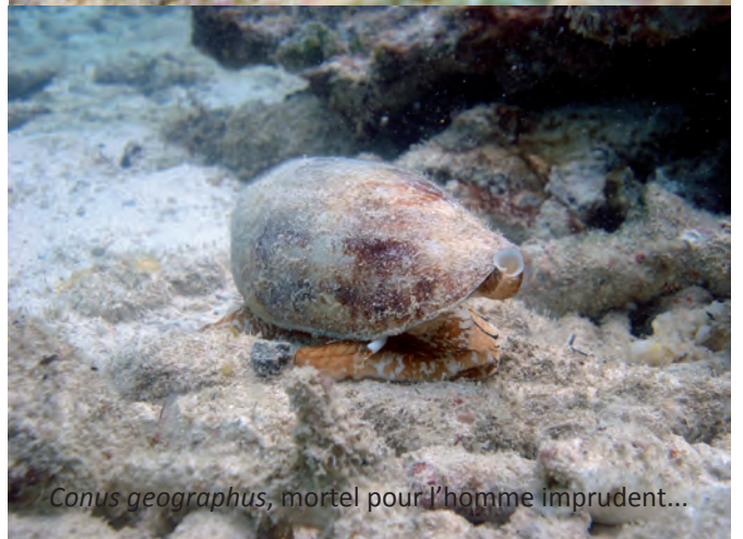
Conus geographus , mortel pour l'homme imprudent...