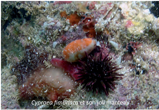
Cypraea fimbriata et son joli manteau