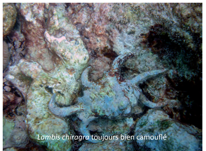
Lambis chiragra toujours bien camouflé