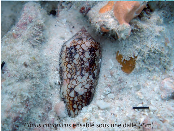
Conus canonicus ensablé sous une dalle (-5m)