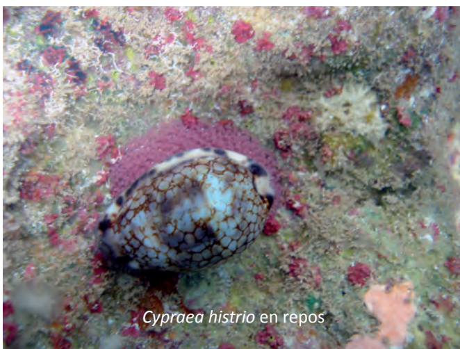
Cypraea histrio en repos