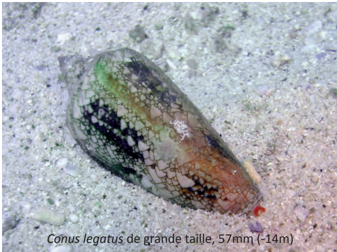
Conus legatus de grande taille, 57mm (-14m)