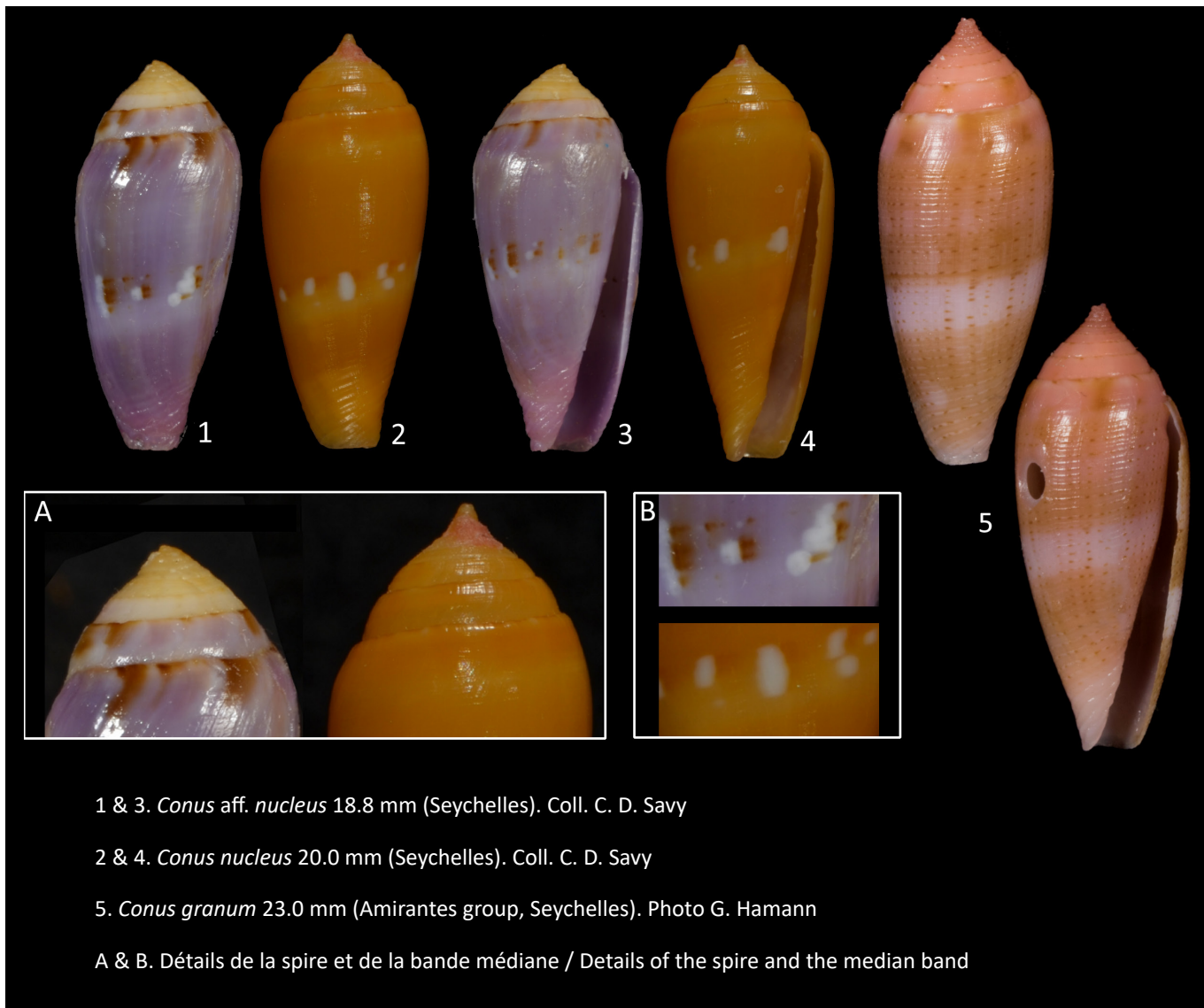
1 & 3. Conus aff. nucleus 18.8 mm (Seychelles). Coll. C. D. Savy